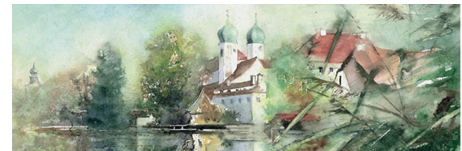
Bildnachweis: Aquarell (auch Titelbild) Hans Torwesten, Kienberg www.atelier-torwesten.de